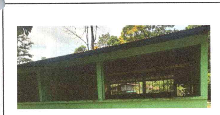
Fotografía 5: Ventanas