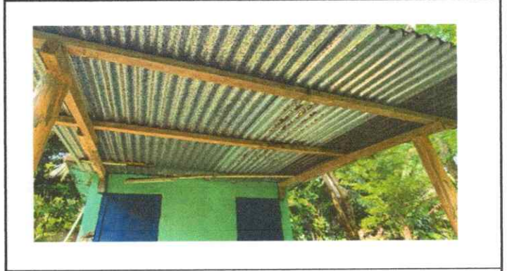
Fotografía 2: Estructura