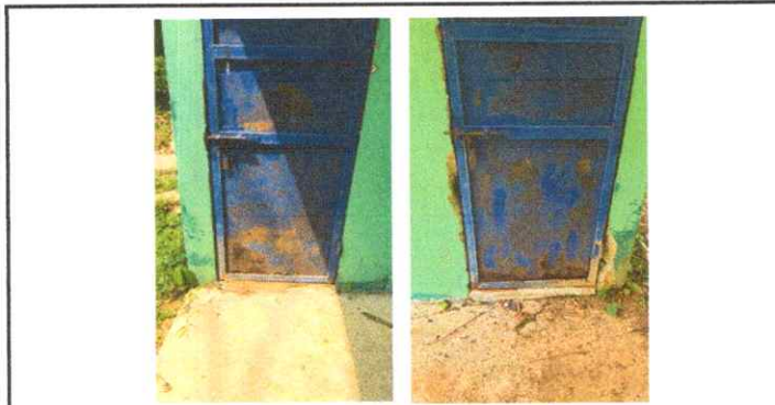
Fotografía 3: puertas de baños