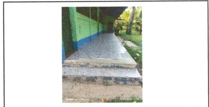
Fotografía 6: Piso

Observación: Si es necesario se pueden agregar hojas adicionales y actualizar el número de hojas.