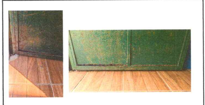
Fotografía 4: Puertas de Aulas