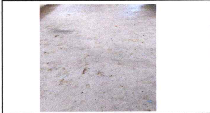
Torta de cemento aplicada en el interior del aula.