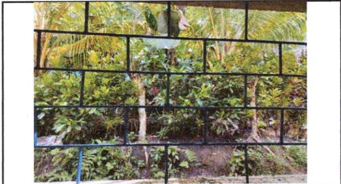
Balcones de las ventanas, ya realizados.