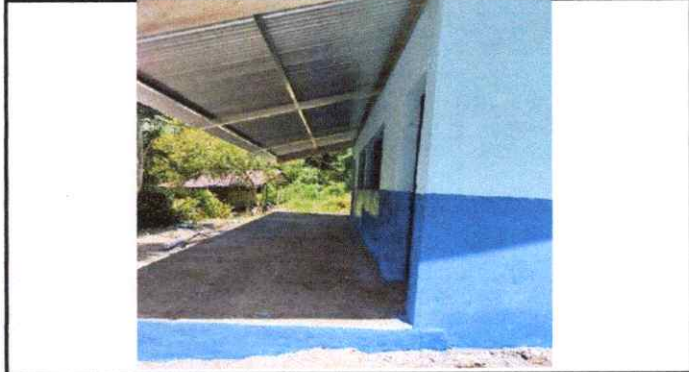
Losa de patio, debidamente efectuada.