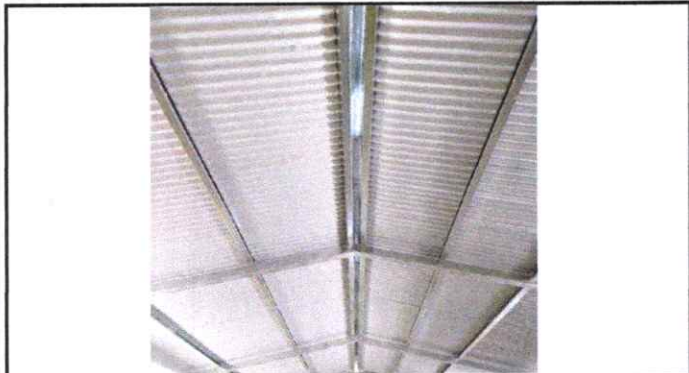
Estructura de techo soldada y laminado completo.