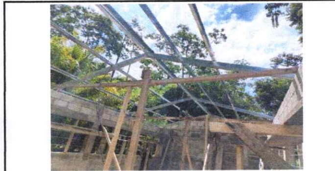
Soldadura de costaneras para estructura de techo.

Observación: Si es necesario se pueden agregar hojas adicionales y actualizar el número de hojas.