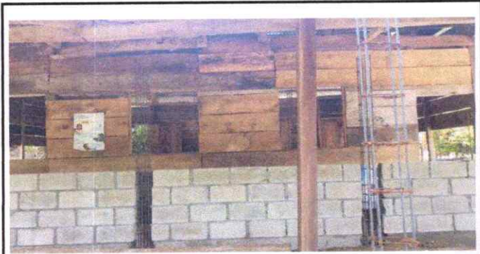
Colocación de las cuatro hiladas de block.