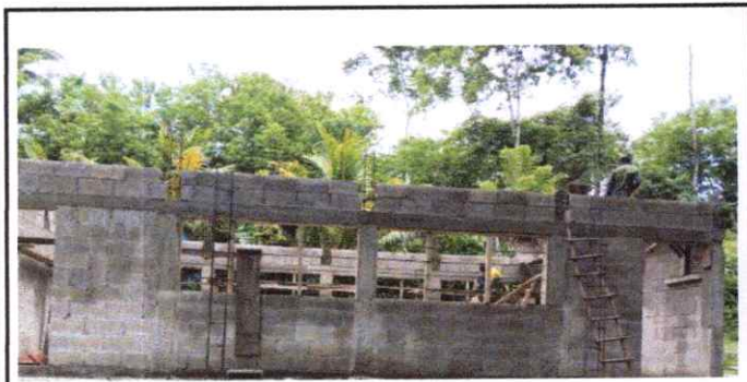
Colocación y soldadura de balcones.