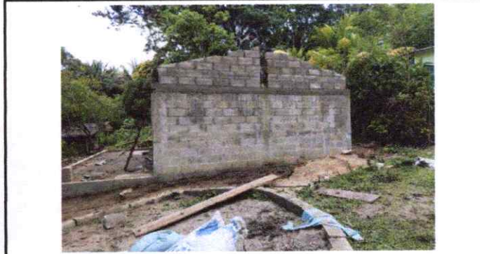
Colocación de hiladas de block en zona de culata y fundición de la misma.