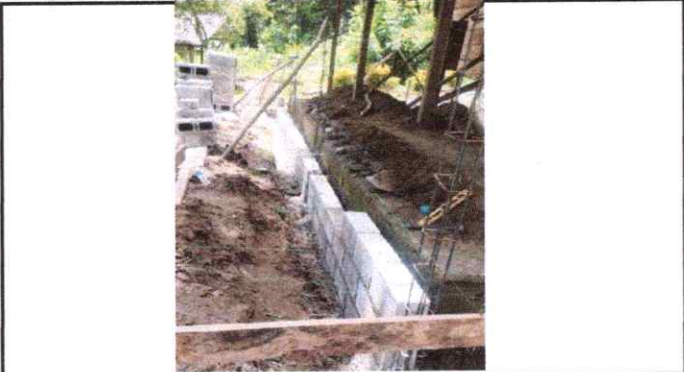
Colocación de más hiladas de block.