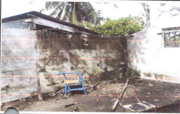
FOTO 1: Sustitución de lámina, por lámina troquelada aluzinc calibre 26