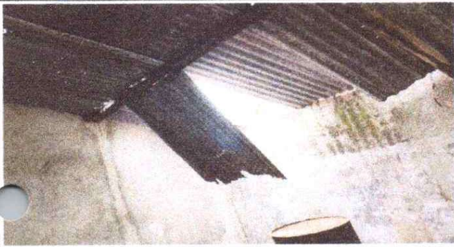
FOTO 1. Sustitución de lámina, por lámina troquelada aluzinc calibre 26