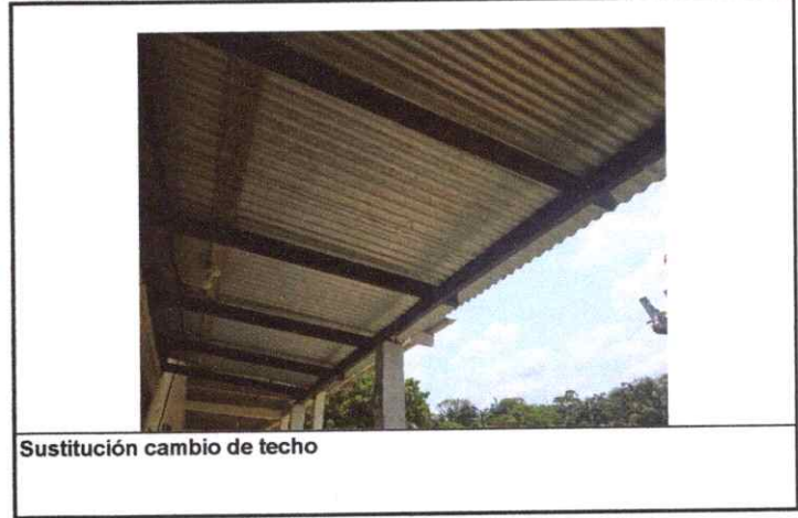
Sustitución cambio de techo