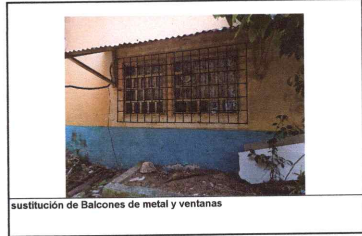
sustitución de Balcones de metal y ventanas