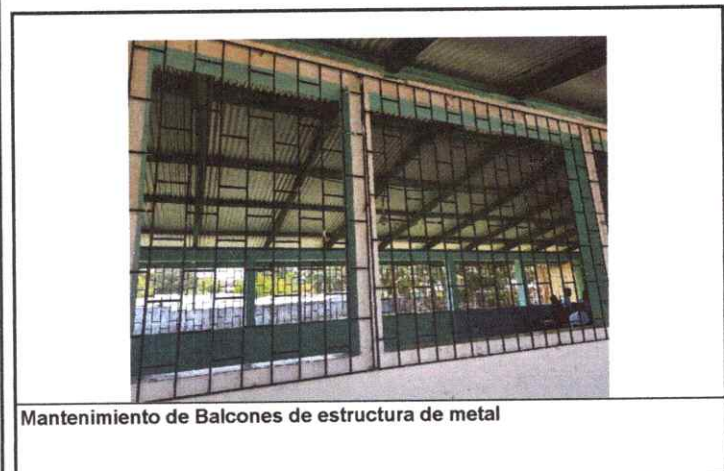
Mantenimiento de Balcones de estructura de metal