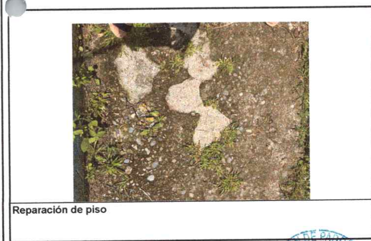
Reparación de piso