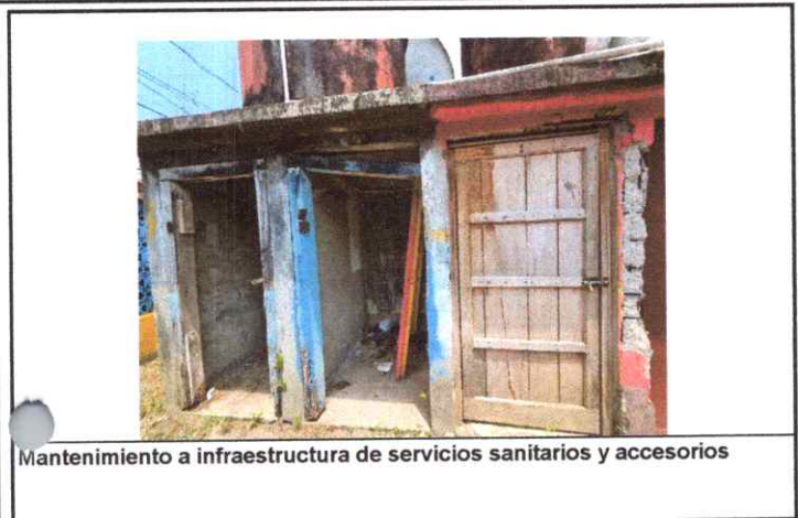
Mantenimiento a infraestructura de servicios sanitarios y accesorios