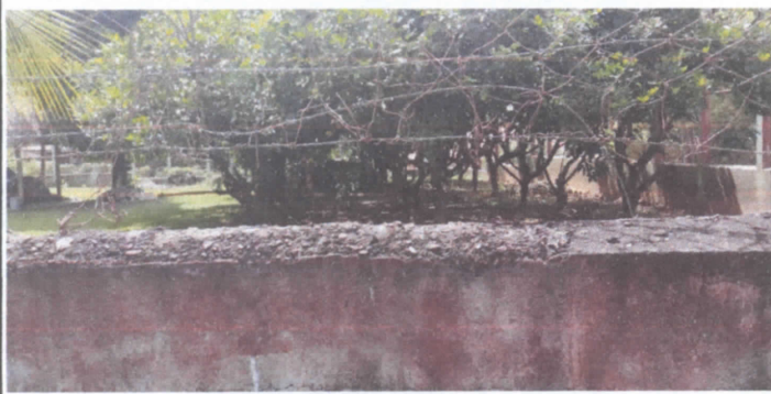
FOTO 3: Reparación de muro perimetral de block con tubo hg y malla galvanizada soleras intermedias y columnas.