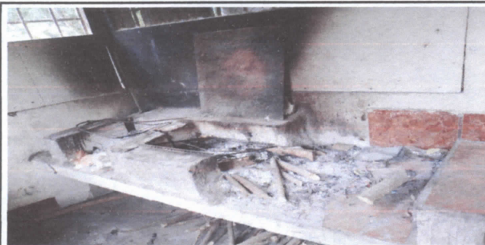
FOTO 5: Sustitución de Estufa Rural (completa) incluye chimenea y plancha de metal