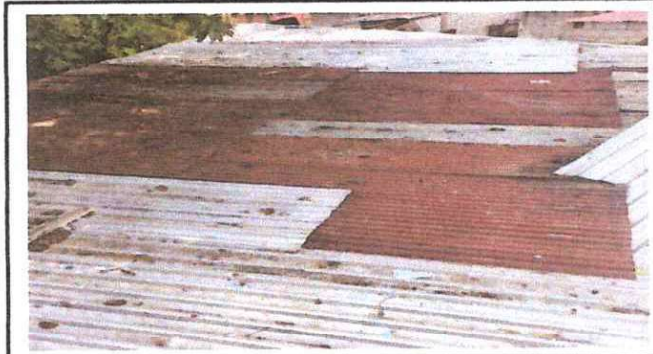
Foto1: Cambio de Lámina por lamina troquelada Aluzinc calibre 26