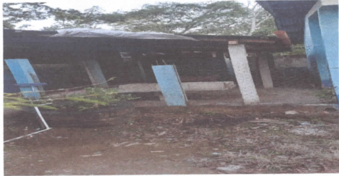
FOTO 1: CUBIERTA DE LAMINA, ESTRUCTURA DE TECHO Y SUSTITUCION DE PISO DE CONCRETO.