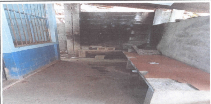
FOTO 5: SUSTITUCION DE ESTUFA RURAL (COMPLETA) incluye chimenea y plancha de metal.

Observación: Si es necesario se pueden agregar hojas adicionales y actualizar el número de hojas.