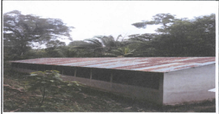
Sustitución de lámina por lámina troquelada