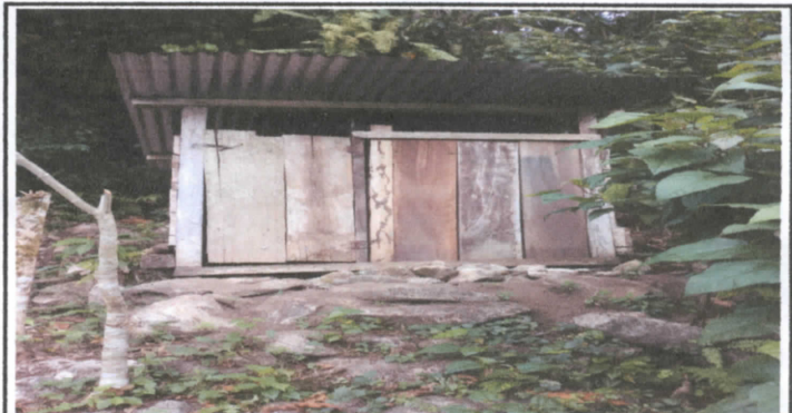
Romozamiento del baño