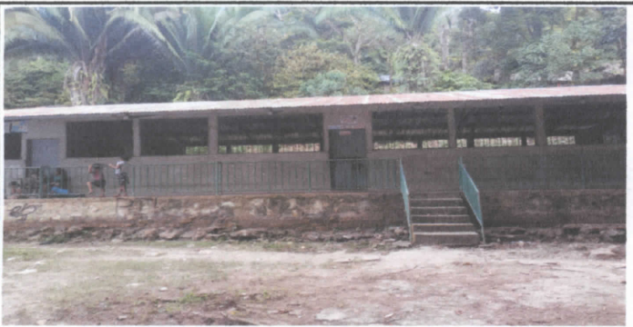
romozamiento de la baranda