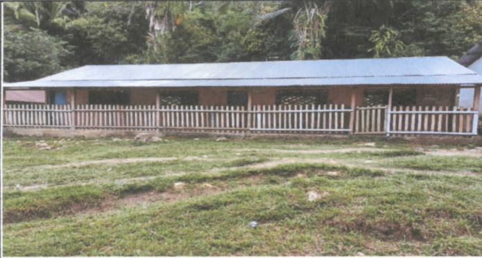
Reparación de baranda de madera por metal