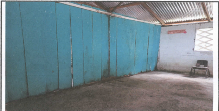
romozamiento del piso y las paredes

Observación: Si es necesario se pueden agregar hojas adicionales y actualizar el número de hojas.