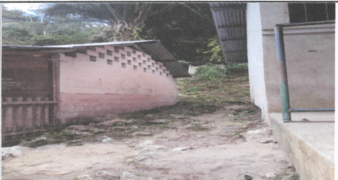
Torta de cemento hacia el baño