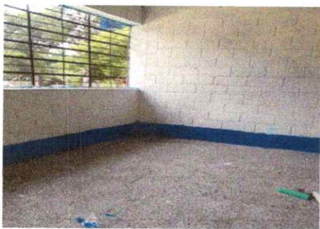
FOTO 2. FINALIZACION DEL ENLAMINADO , BANQUETA y PINTURA.30/5/24