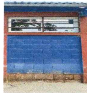
FOTO 5. Ventanas nuevas en sustitucion de las quebradas.30/5/24