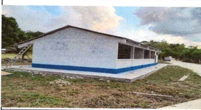
FOTO 1. FINALIZACION DEL ENLAMINADO Y BANQUETA. 30/5/24