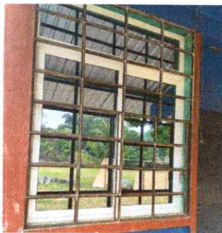
FOTO 4. PUERTAS NUEVAS DE SANITARIO Y AULAS.