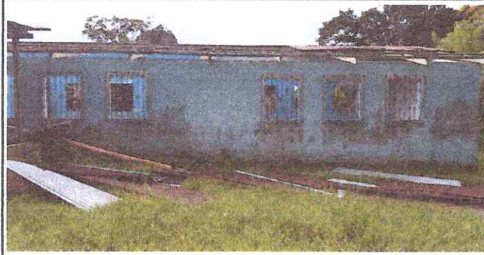
FOTO 1. Sustrucción de lámina, por lámina troquelada aluzinc calibre 26