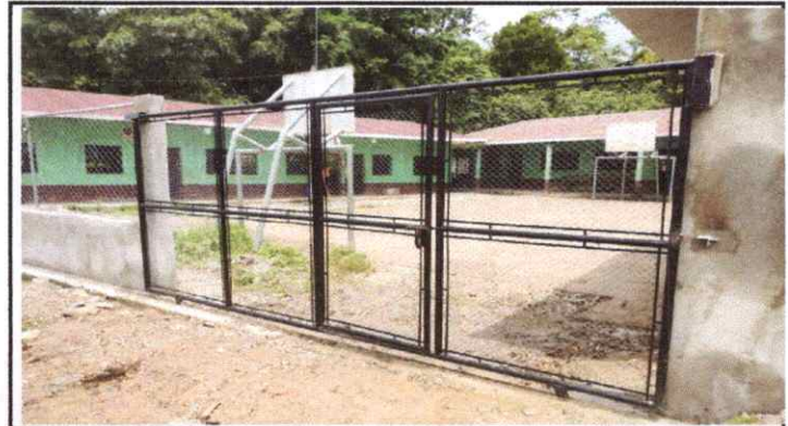
foto 4: sustitucion de portón metálico y malla a portón de lamina de metal.