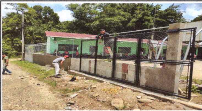
foto 3: sustitucion de potón metálico y malla a malla a porón de lamina de metal.