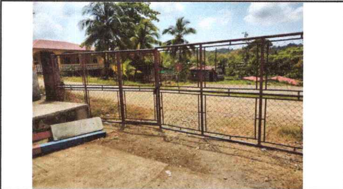
Foto 3: Sustrucción de Portón Metálico y Malla a Portón de Lámina de Metal.