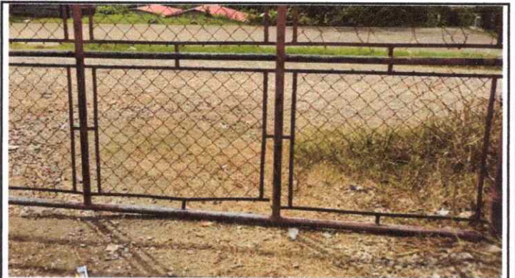
Foto 4: Sustrucción de Portón Metálico y Malla a Portón de Lámina de Metal.