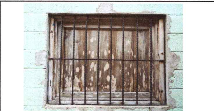
Foto 5: Sustrucción de Dos Ventanas de Madera a Ventanas de Vidrio y PVC.