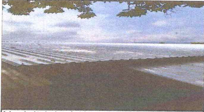
Así quedó el techo después del remozamiento.