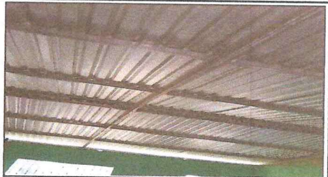
Se puede notar el cambio en la estructura y en la lámina después del remozamiento.

Observación: Si es necesario se pueden agregar hojas adicionales y actualizar el número de hojas.