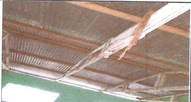
La madera que sostiene la lámina tiene polilla y algunas ya están quebradas.

Observación: Si es necesario se pueden agregar hojas adicionales y actualizar el número de hojas.