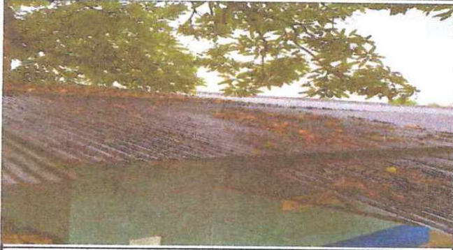
Lámina en mal estado, corroida y con agujeros.