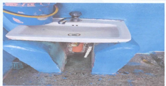
Instalación de lavamanos

Observación: Si es necesario se pueden agregar hojas adicionales y actualizar el número de hojas.