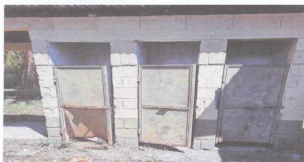
Sustitución de puerta en servicios sanitarios