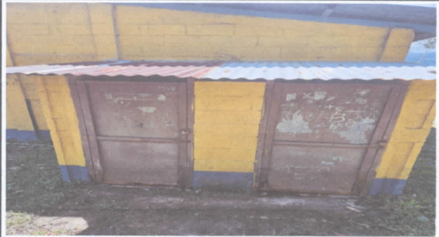
Mantenimiento a estructura (lijado, cambio de tubo , cepillado, sujeciones, aplicación de pintura) a puertas servicios sanitarios