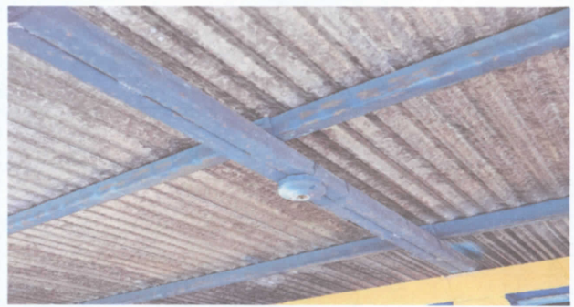
Sustitución de lamparas tipo LED