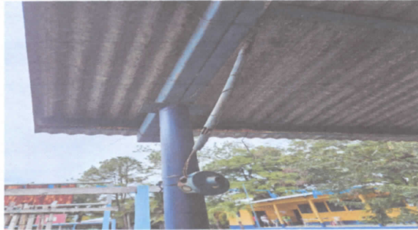
Reparación de cableado eléctrico