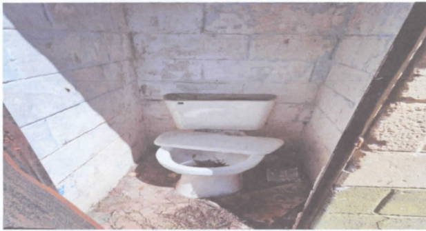
SERVICIOS SANITARIOS Y SUS ACCESORIOS