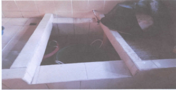
Sustitución de pila de dos lavaderos

Observación: Si es necesario se pueden agregar hojas adicionales y actualizar el número de hojas.