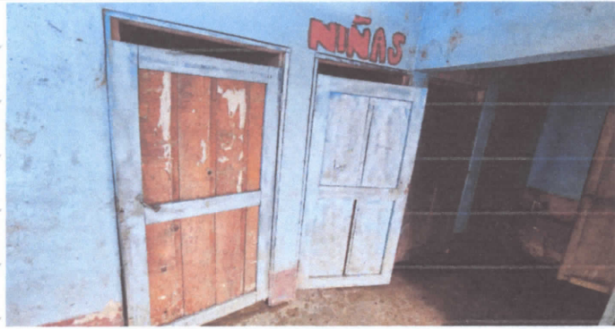
Sustitución de puerta en servicios sanitarios