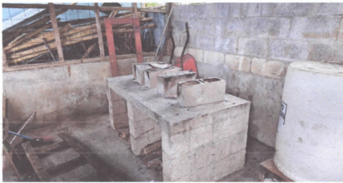
Sustitución de estufa rural (completa) incluye chimenea y plancha de metal