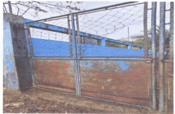
Mantenimiento a portones de metal