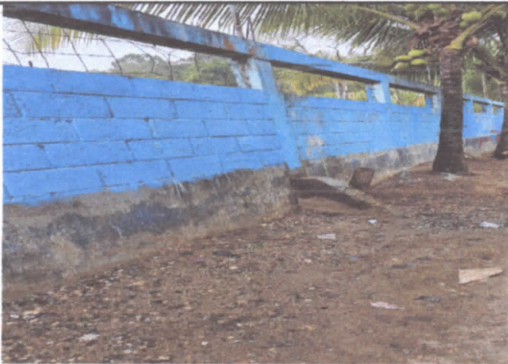
Reparación de muro perimetral de block.