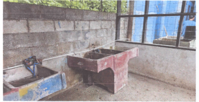
Sustitución de pila de cemento de dos lavadero