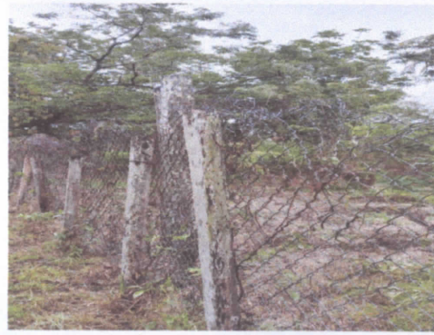
REPARACIÓN DE MURO PERIMETRAL CON UBICACIÓN AL NORTE