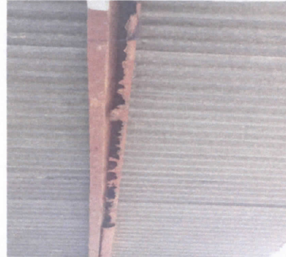
REPARACIÓN DE VIGA DE METAL