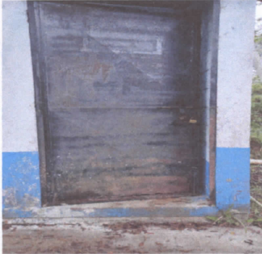
REPARACIÓN DE PUERTA DE METAL