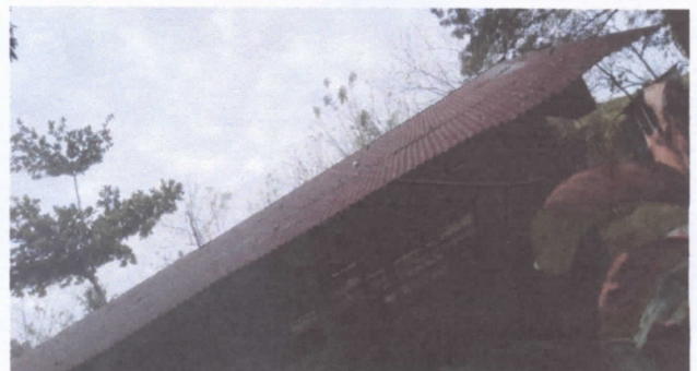
REPARACIÓN DE TECHADO

Observación: Si es necesario se pueden agregar hojas adicionales y actualizar el número de hojas.