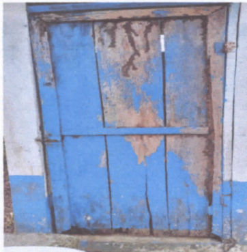
CAMBIO DE PUERTA DE MADERA POR PUERTA DE METAL