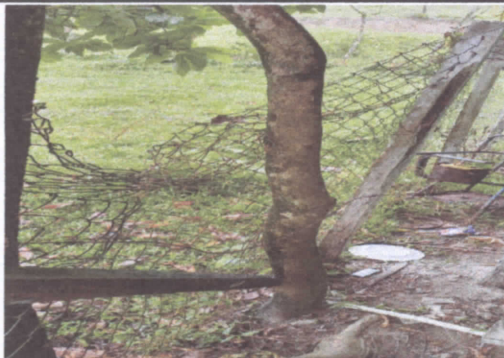
REPARACIÓN DE MURO PERIMETRAL CON UBICACIÓN AL ESTE