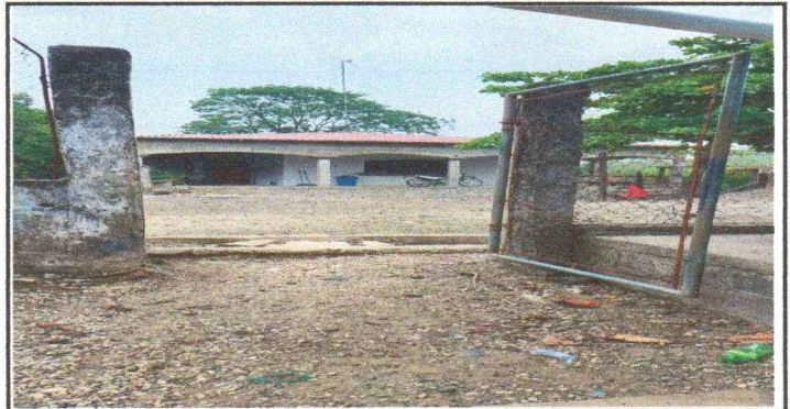
FOTOGRAFIA 6: FABRICACION E INSTALACION DE PORTON DE INGRESO DE METAL Y MALLA

Observación: Si es necesario se pueden agregar hojas adicionales y actualizar el número de hojas.