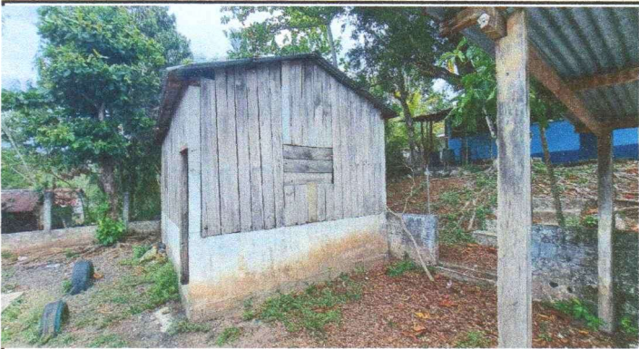
FOTOGRAFIA 3: REMODELACION DE MURO EN COCINA CON REFUERZO ESTRUCTURAL