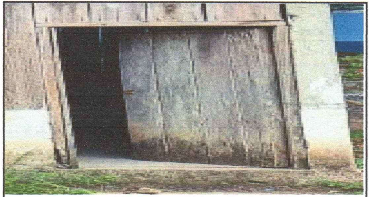
FOTOGRAFIA 4: SUSTITUCION DE PUERTA