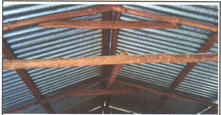
FOTOGRAFIA 2: SUSTITUCION DE ESTRUCTURA DE SOPORTE DE MADERA, POR METAL