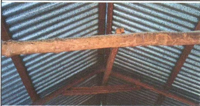
FOTOGRAFIA 1: SUSTITUCION DE LAMINA POR LAMINA ALUZINC CALIBRE 26