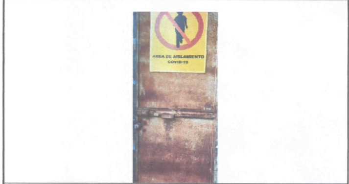
Foto 4. Sustitución de chapa