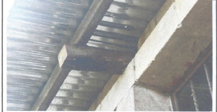
Foto 2. Sustitución de estructura de soporte de metal, por metal