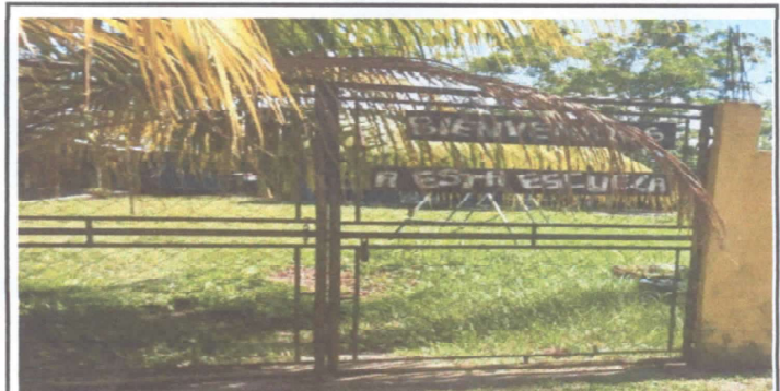
Foto 6. Mantenimiento a portones de metal

Observación: Si es necesario se pueden agregar fotos adicionales y actualizar el número de hojas.