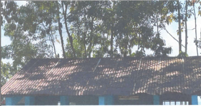
Foto 1. Sustitución de lámina, por lámina troquelada aluzinc calibre 26