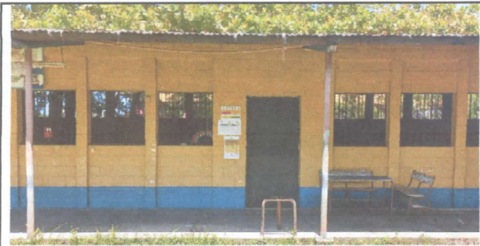
Foto 4. Pintura en muros exteriores e interiores