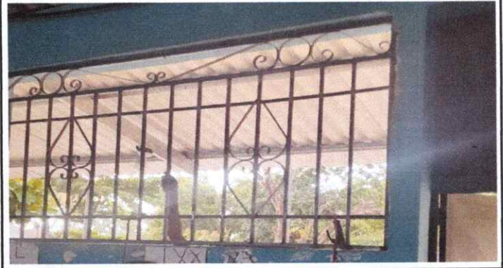
FABRICACIÓN E INSTALACIÓN DE VENTANA-BALCON DE METAL