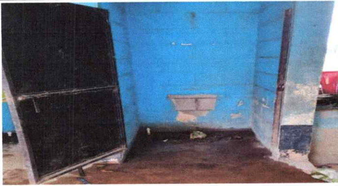
SUSTITUCIÓN DE INODORO