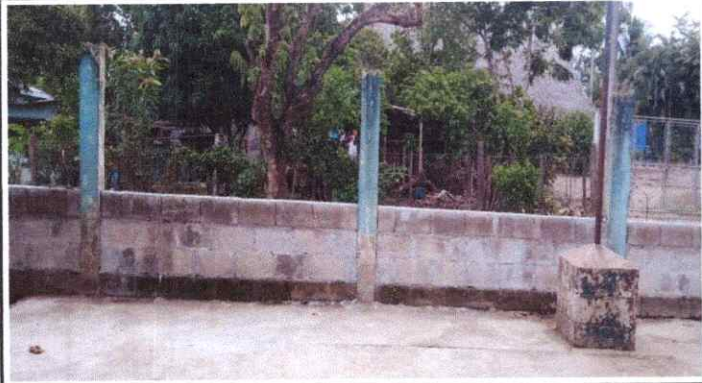
REPARACIÓN DE MURO PERIMETRAL DE BLOCK CON TUBO HG Y MALLA GALVANIZADA