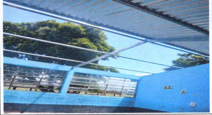
SUSTITUCIÓN DE LAMINA CALIBRE 26