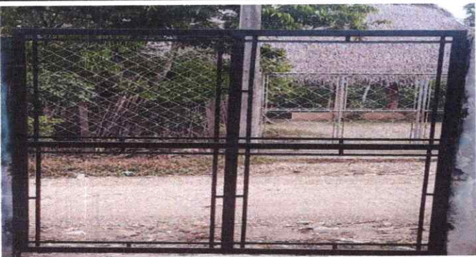
SUSTITUCIÓN DE PORTON DE METAL

Observación: Si es necesario se pueden agregar hojas adicionales y actualizar el número de hojas.