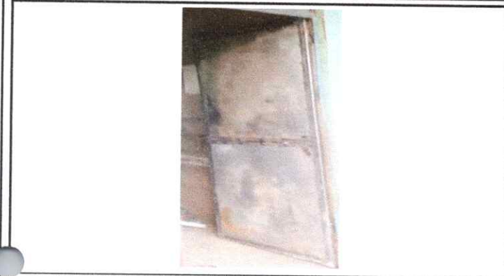
1. INSTALANDO PUERTA DE METAL