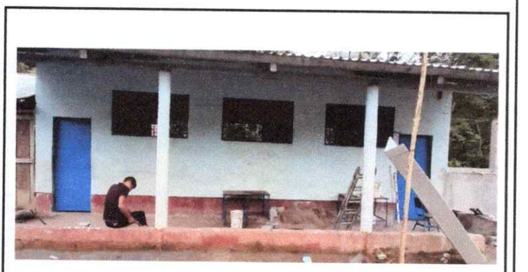
4. APLICANDO PISO DE CEMENTO LOQUIDO