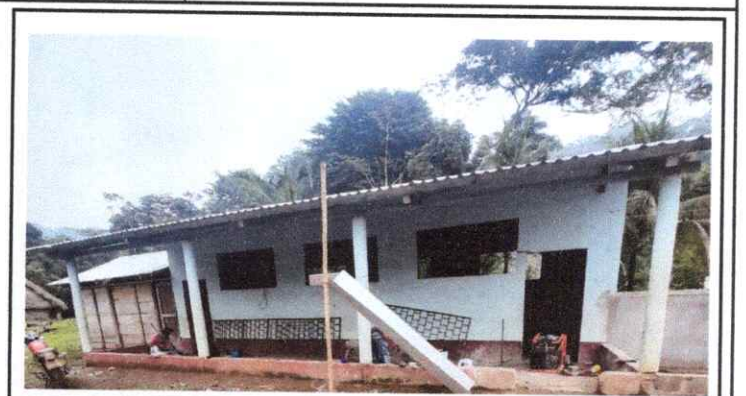
2. INSTALANDO BALCONES DE VENTANAS