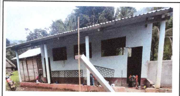
3. INSTALANDO PUERTA Y BALCONES