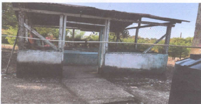
Foto 5. Se requiere cambiar el techo, la puerta y pinar la cocina del establecimiento educativo.