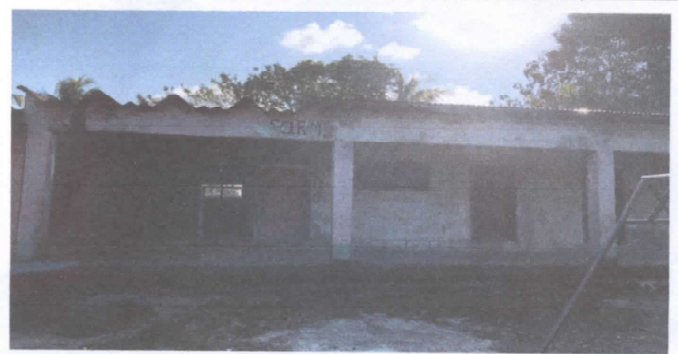
Foto 4. Se necesita pintura para pintar la infraestructura del centro educativo