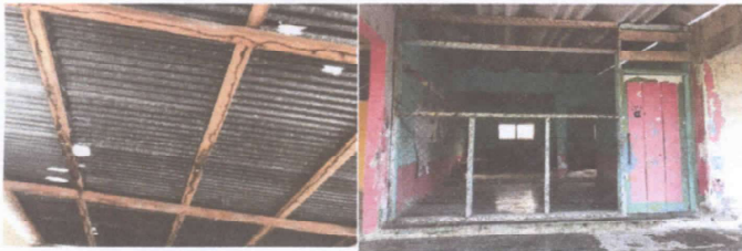
Foto 1. Se pretende sustituir el soporte del techo de madera por metal