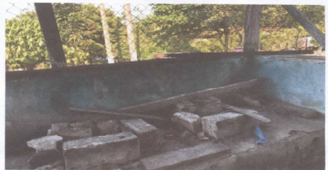
Foto 6. Reconstruir un polleton dentro de la cocina para mejorar el lugar donde se prepara el alimento de los niños

Observación: Si es necesario se pueden agregar hojas adicionales y actualizar el número de hojas.