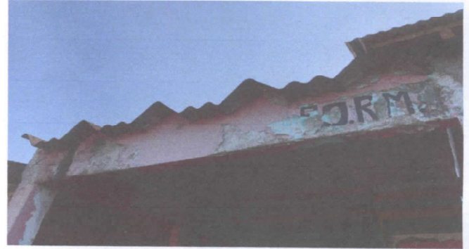
Foto 2. Se requiere cambiar el techo del centro educativo por lamina troquelada aluzinc calibre 26