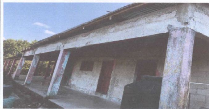
Foto 3 Se requiere material de repello para doscientos dieciséis m2 de dos aulas