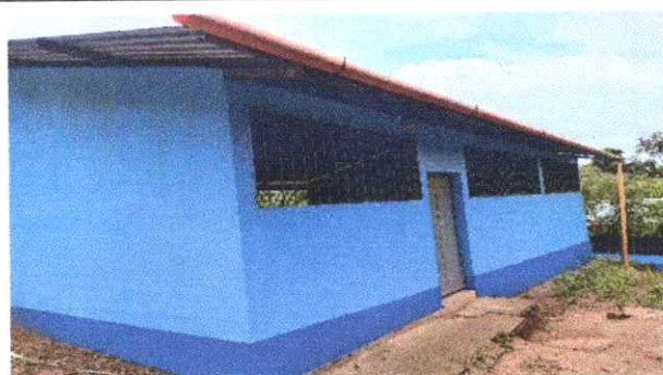
Finalización de la reparación de la baja de agua de tubo PVC.