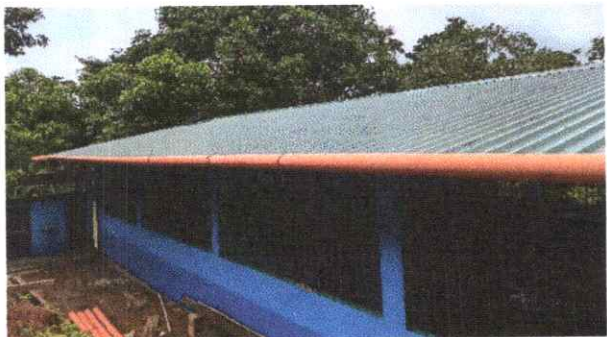
Finalización del cambio de láminas troqueladas.