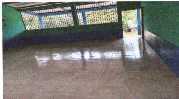
Finalización del cambio de piso cerámico.