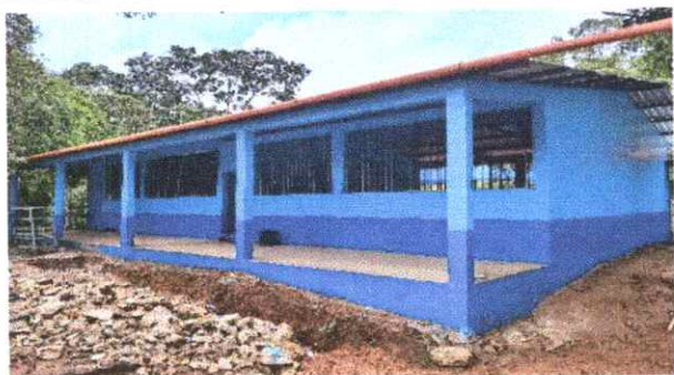
Finalización de aplicación de pintura en muros exteriores e interiores.