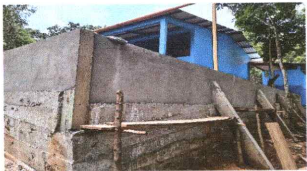
Finalización de la reparación del muro de contención.