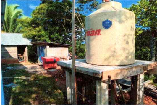
finalizacion de colocacion de colocacion del tanque