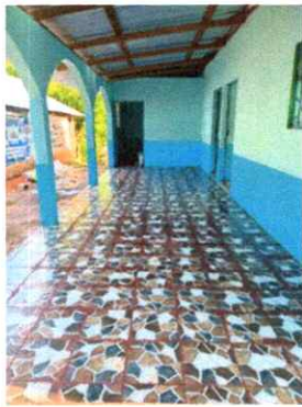
finalizacion de la colocacion del piso