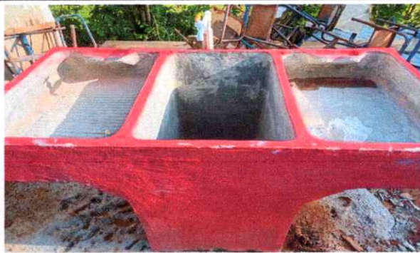
finalizacion de la colocacion de la pila