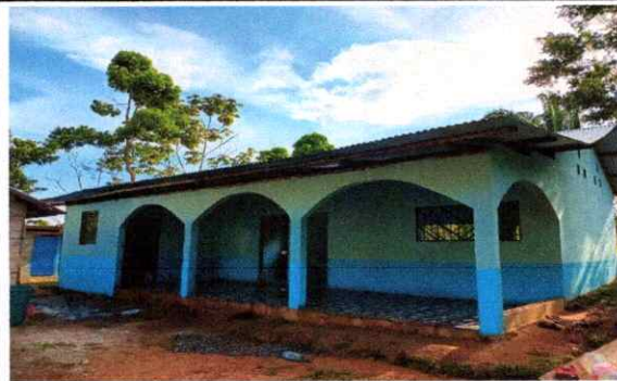
finalizacion del cambio de lamina

Observación: Si es necesario se pueden agregar hojas adicionales y actualizar el número de hojas.