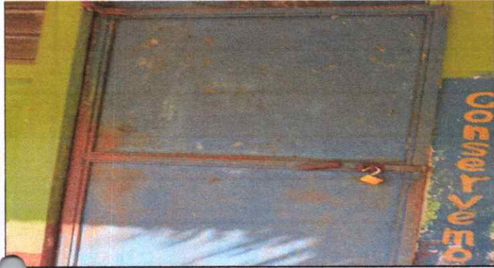
Puertas del aula en mal estado.