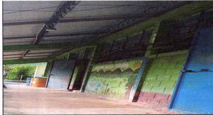
Ventanas con vidrio y metal dañados.