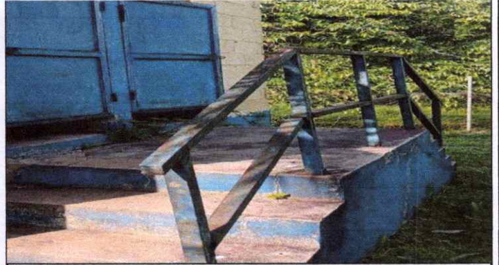
Barandas con necesidad de reparación.