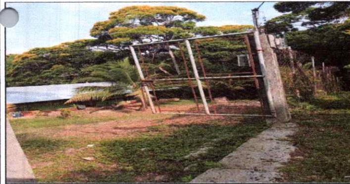
Portones corroidos por la oxidación.