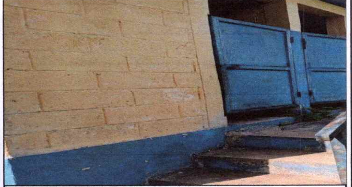
Puertas del baño deterioradas por la interperie.