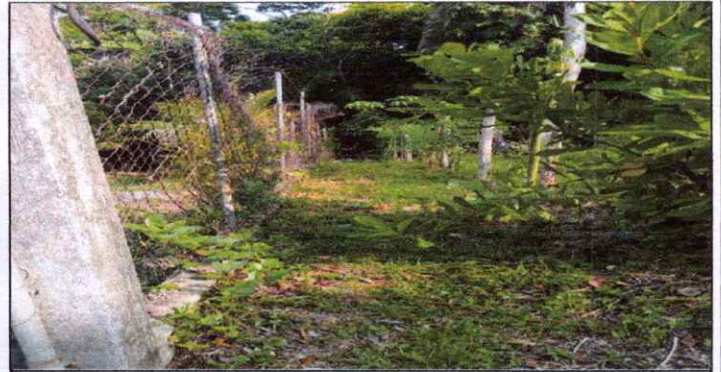
Cerco perimetral dañado por la antigüedad.

Observación: Si es necesario se pueden agregar hojas adicionales y actualizar el número de hojas.