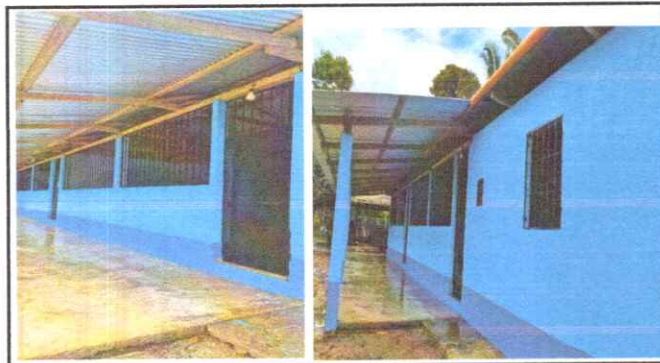
Foto 3: Se colocó focos y cables nuevos de energía eléctrica y pintura completa de la Escuela.