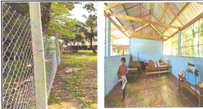
Foto 1: Colocacion de Maya completa y Pintura completa en el Aula.