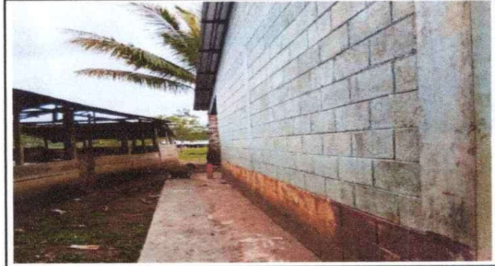
Piso de Torta de Concreto