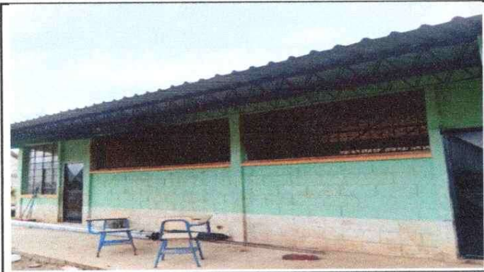
Lámina Instalada troquelada aluzinc calibre 26