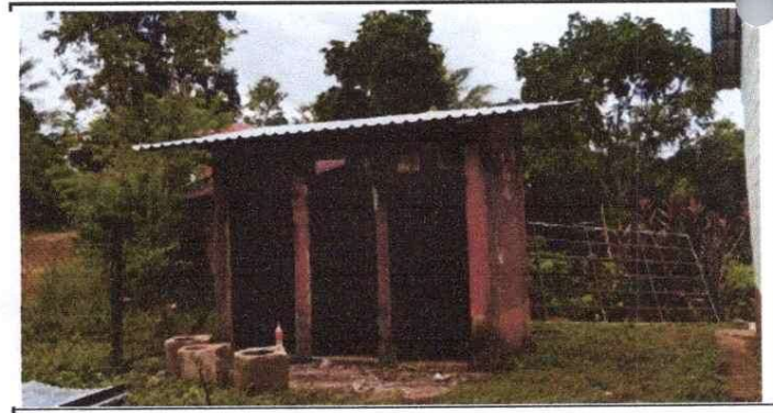
Servicio de Sanitarios

Observación: Si es necesario se pueden agregar hojas adicionales y actualizar el número de hojas.