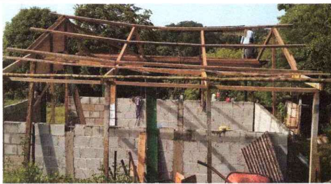
SUSTITUCIÓN DE LAMINA TROQUELADA Y SUSTITUCIÓN DE SOPORTE DE MADERA POR METAL