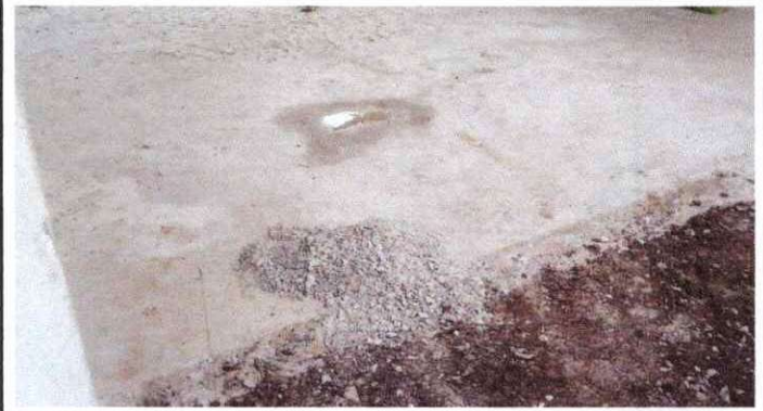
SUSTITUCION DE PISO DE TORTA DE CONCRETO