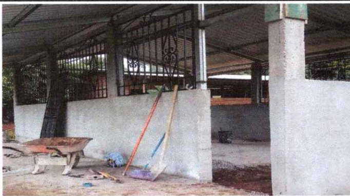
SUSTITUCIÓN DE PUERTAS Y VENTANAS