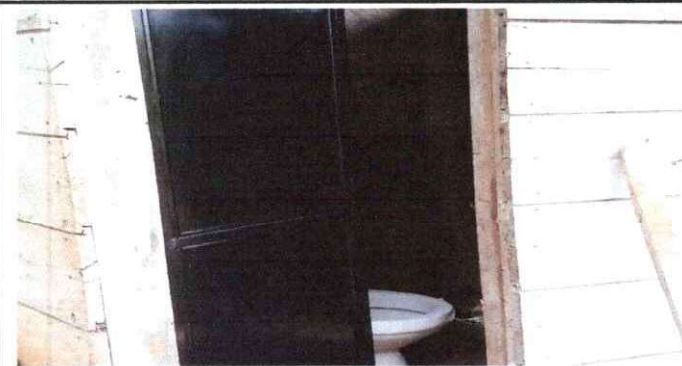
SUSTITUCIÓN DE INODORO