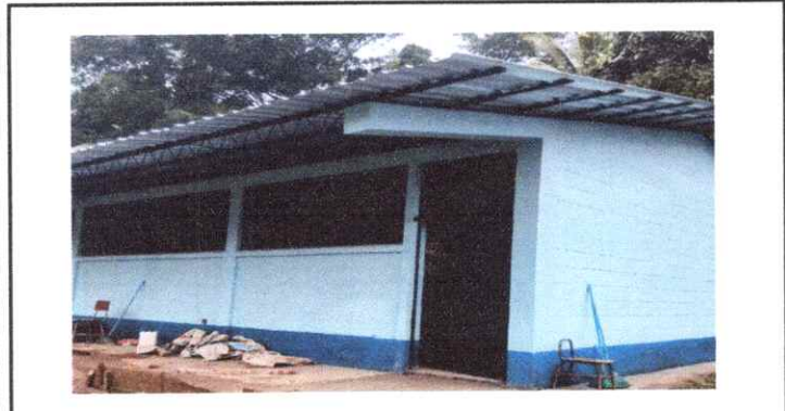
3. Puerta de metal instalada y ventanas