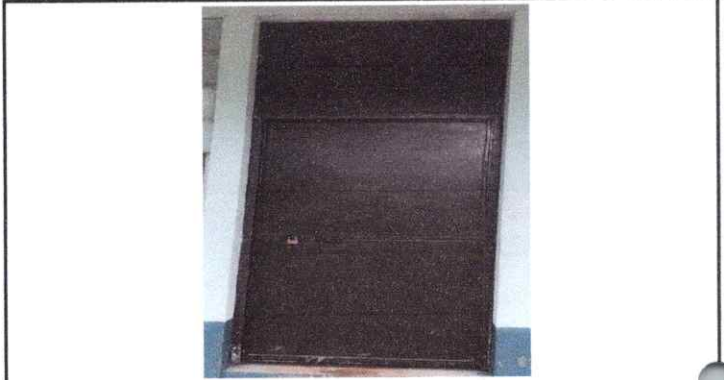
2. Puerta de metal restaurado