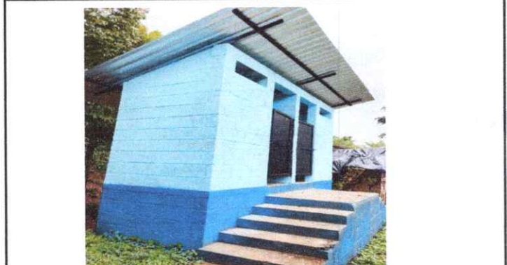
4. Estructuras y puerta de servicios sanitarios