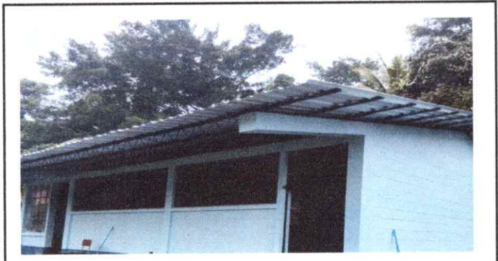
1. Lámina troquelada calibre 26 instalada