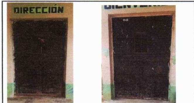
Foto1: Fabricación e Instalación de Puertas en Aulas