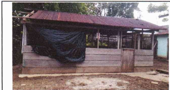
Foto 2: Sustitución de Soporte de Madera, por Metal y Colocación de Columnas de Metal en Aula, Sustitución de lámina, por lámina troquelada Calibre 26 en Aula