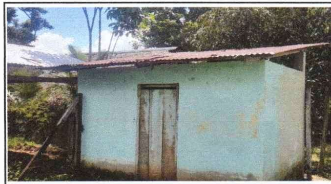
Foto 4: Sustitución de Soporte de Madera, por Metal en Baños, Sustitución de lámina, por lámina troquelada Calibre 26 en Baños,