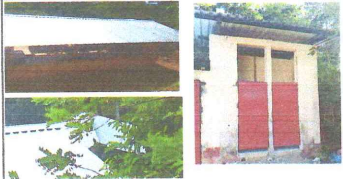
Foto 1: Sustitucion de lámina, lámina aluzinc calibre 26 en aula, cocina y baño.