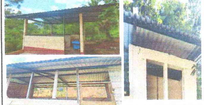
Fotos 2: Sustitucion de estructura de soporte de madera, por metal en Aula, cocina y Baño