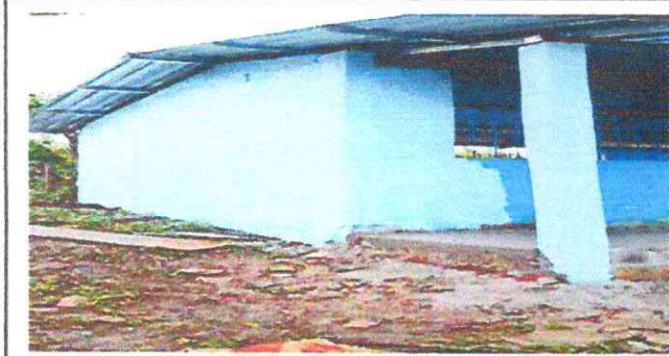
Foto 1: SUSTITUCIÓN DE LAMINA POR LAMINA TROQUELADA ALUZINC CALIBRE 26