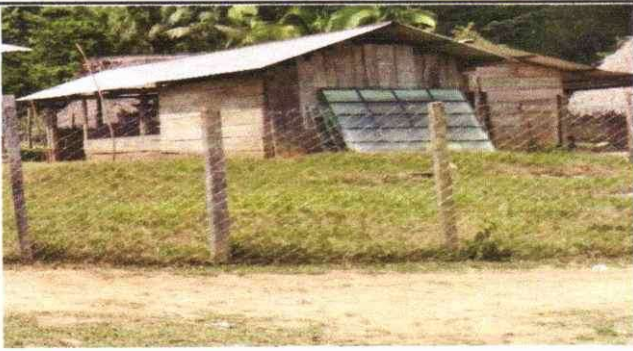
Foto 3: Reparación de muro perimetral de block con tubo hg y malla galvanizada