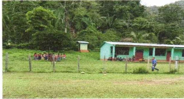
Foto 1: Reparación de muro perimetral de block con tubo hg y malla galvanizada