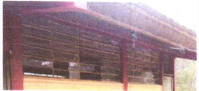
4 Sustitución de estructura de metal de ventana