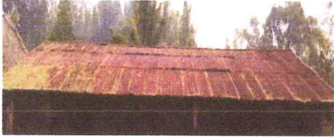
1 Sustitución de lámina, por lamina troquelada aluzinc calibre 26, aula y baños