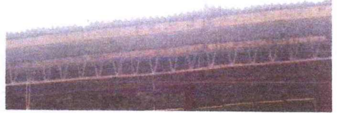
2 Mantenimiento a estructura de soporte de metal