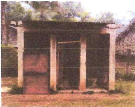
5. Mantenimiento a estructura (lijado, cambio de tubo , cepillado, sujeciones, aplicación de pintura) a puertas servicios sanitarios

Observación: Si es necesario se pueden agregar hojas adicionales y actualizar el número de hojas.