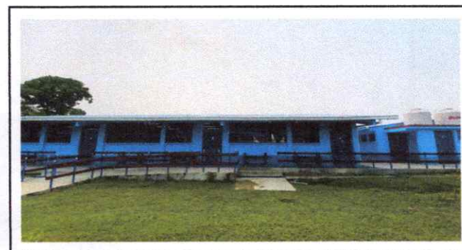
Foto 6: Finalización de pintura en muros exteriores e interiores.

Observación: Si es necesario se pueden agregar hojas adicionales y actualizar el número de hojas.