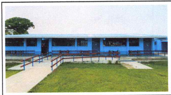
Foto 10: Finalización remozamiento INEB. TS. Alfredo Ballsels Tojo.