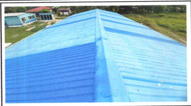
Foto7: Finalización de pañuelos.