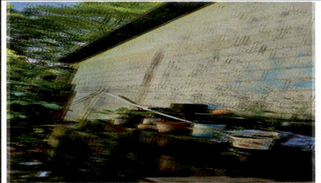
Foto 4: SUMINISTRO E INSTALACION DE ESTRUCTURA METALICA CON REFUERZO ESTRUCTURAL