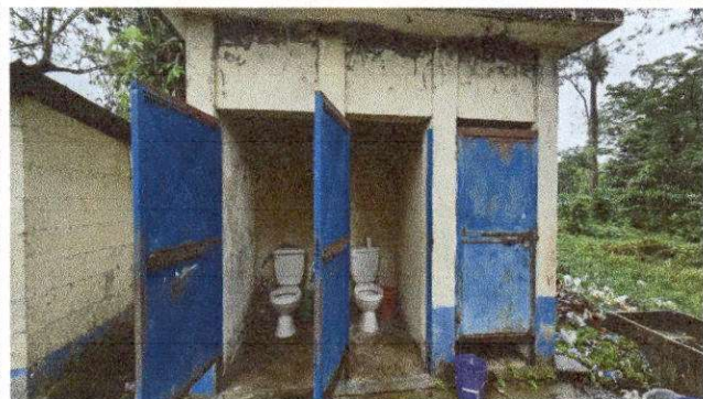
Foto 11: MODULO "B" SUMINISTRO E INSTALACION DE PUERTA CON PASADOR