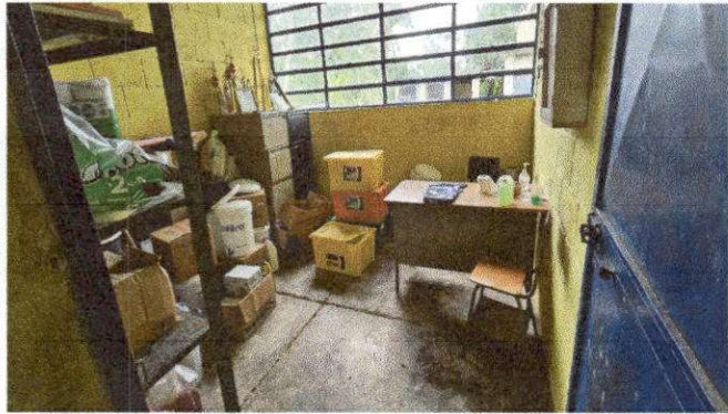
Foto 7: MODULO "A" SUMINISTRO Y COLOCACION DE PISO CERAMICO ANTIDESLIZANTE