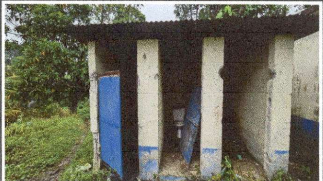
Foto 10: MODULO "B" SUMINISTRO E INSTALACION DE LAMINA TROQUELADA CAL, 26 SUMINISTRO E INSTALACION DE PUERTA CON PASADOR