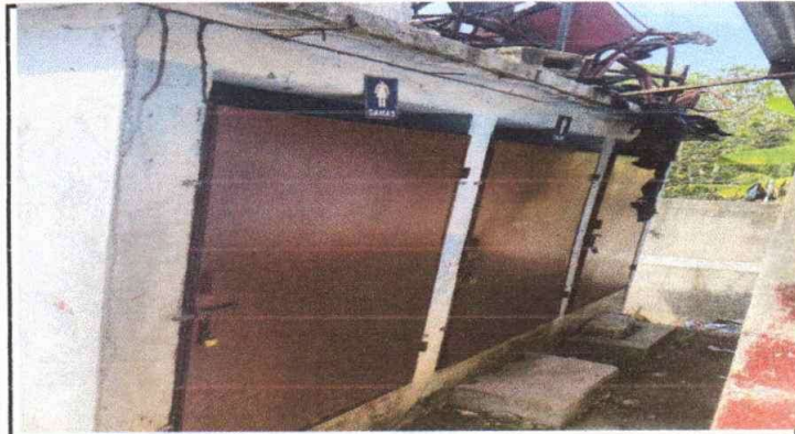
Puertas de los servicios sanitarios oxidadas.