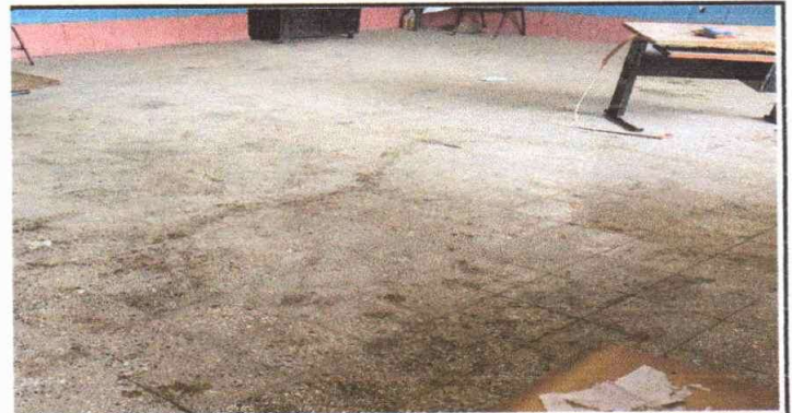
Deterioro del piso de las aulas.

Observación: Si es necesario se pueden agregar hojas adicionales y actualizar el número de hojas.