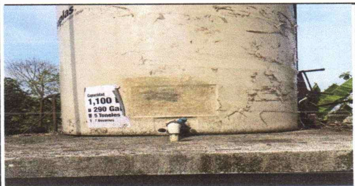
Deterioro del Cisterna para captación de agua llovida.