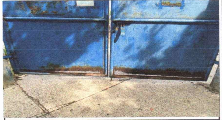
Portón de acceso principal deteriorado.