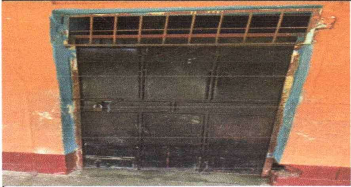
Puertas de acceso a las aulas en desperfecto estado.