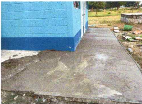
Foto 5: Proceso de fundición de banquetta perimetral en los baños.