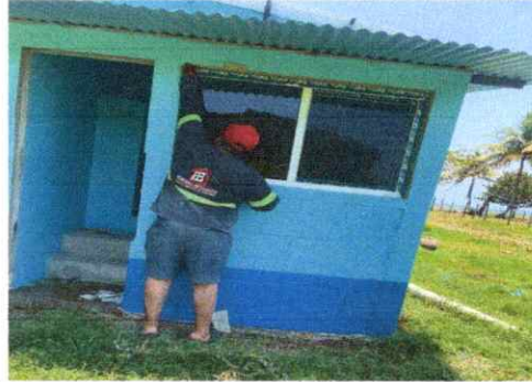
Foto 2: INSTALACIÓN DE VENTANAS DE UPVC EN LOS SERVICIOS SANITARIOS.