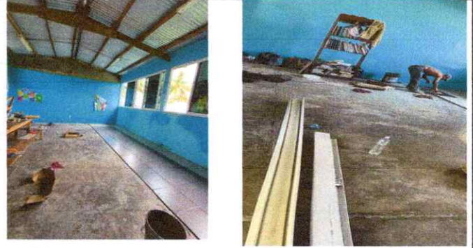
Foto 6: Reparación de torta de concreto e instalación de piso ceramico.

Observación: Si es necesario se pueden agregar hojas adicionales y actualizar el número de hojas.