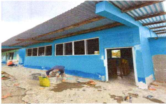
Foto1: proceso de resane de las paredes.