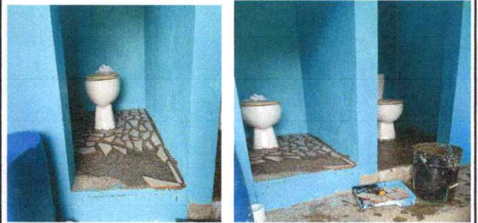
Foto 4: colocando el cerámico en forma de mosaico al piso de los baños.