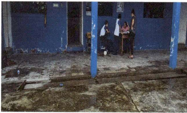
Foto 3: SUMINISTRO E INSTALACION DE PISO CERAMICO ANTIDESLIZANTE EN PASILLO