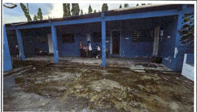
Foto 2: REMOZAMIENTO DE AULAS COLOCACION Y SUMINISTRO DE PISO CERAMICO ANTIDESLIZANTE