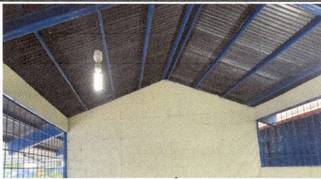
Foto 9: REMOZAMIENTO DE TECHO, SUMINISTRO E INSTALACION DE CIELO FALSO