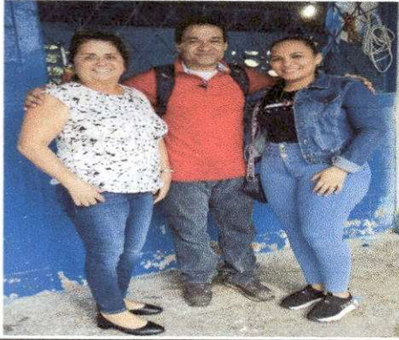
Foto1: .EVALUADOR DE CAMPO CON AUTORIDADES DE ESTABLECIMIENTO EDUCATIVO