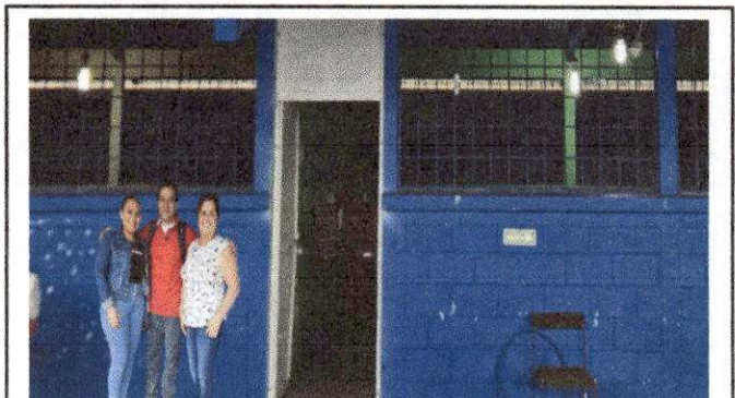
Foto 12: .EVALUADOR DE CAMPO CON AUTORIDADES DE ESTABLECIMIENTO EDUCATIVO