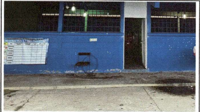
Foto 4: EN AREA DE CORREDOR SE SUMINISTRA E INSTALARA PISO CERAMICO ANTIDESLIZANTE