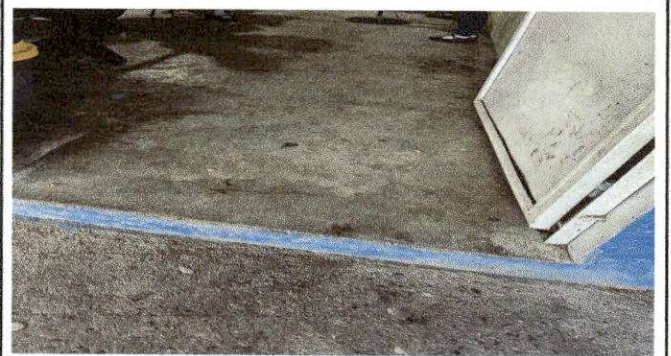
Foto 6: REMOZAMIENTO DE AULAS PARA SUMINISTRO Y COLOCACION DE PISO