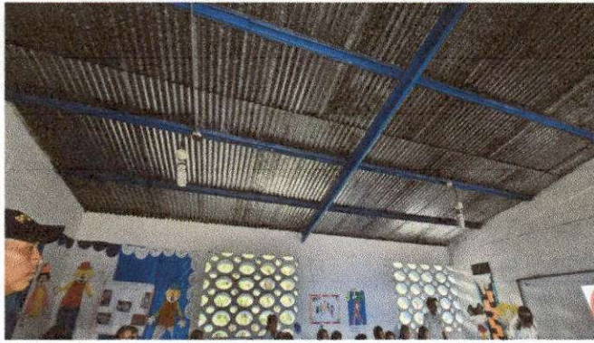
Foto7: . COLOCACION DE CIELO FALSO