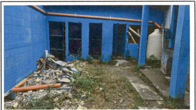
Foto 10 SUMINISTRO E INSTALACION DE PISO TORTA DE CONCRETO