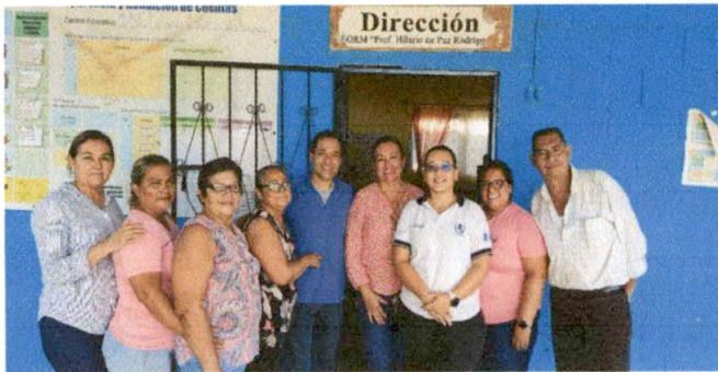
Foto1: EVALUADOR DE CAMPO CON AUTORIDADES DE CENTRO EDUCATIVO