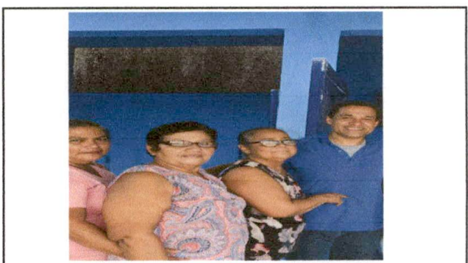
Foto 12 EVALUADOR DE CAMPO CON AUTORIDADES DE CENTRO EDUCATIVO