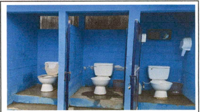
Foto 8 SUMINISTRO E INSTALACION DE PISO CERAMICO ANTIDESLIZANTE Y CERAMICO