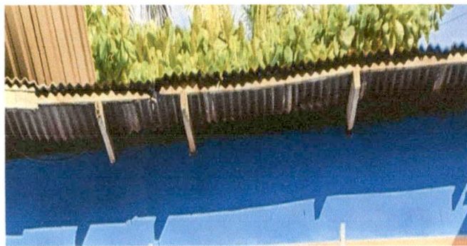
Foto 3: SUMINIISTRO E INSTALACION DE LAMINA TROQUELADA CALIBRE, 26