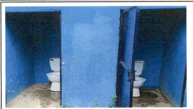
Foto7: SUMINISTRO E INSTALACION DE INODORO