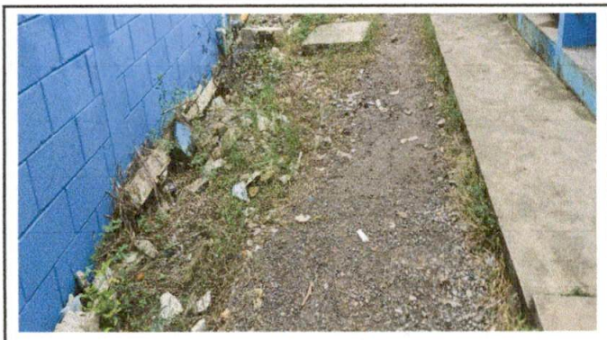
Foto 9 SUMINISTRO E INSTALACION DE PISO TORTA DE CONCRETO