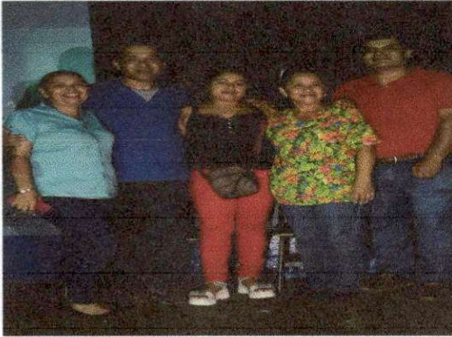
Foto1: .EVALUADOR DE CAMPO CON AUTORIDADES DEL ESTABLECIMIENTO EDUCATIVO