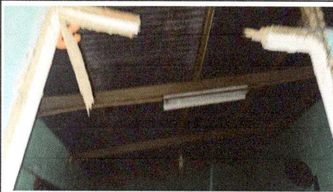
Foto 9 SUMINISTRO Y COLOCACION DE LAMINA TROQUELADA