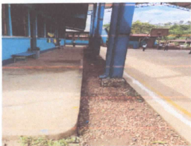
foto 5 sustitucion de piso de concreto por granito