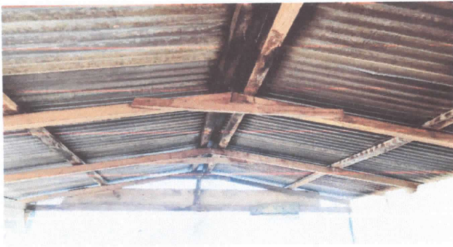
foto 3.sustitucion de estructura de madera, por metal