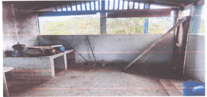
foto 2 sustitucion de piso de concreto por piso de granito