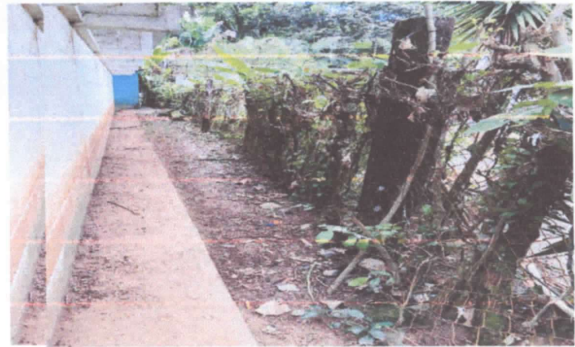
foto 4. construcción de muro perimetral de block.