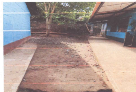
foto 6 reparacion por piso de granito

Observación: Si es necesario se pueden agregar hojas adicionales y actualizar el número de hojas.