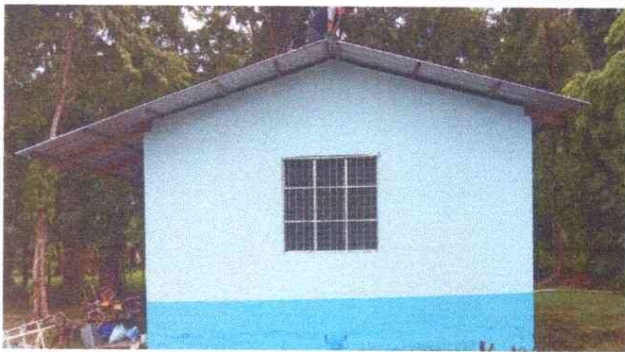
Foto1: Sustitucion de lamina , por lamina troqueleda alucin calibre 26