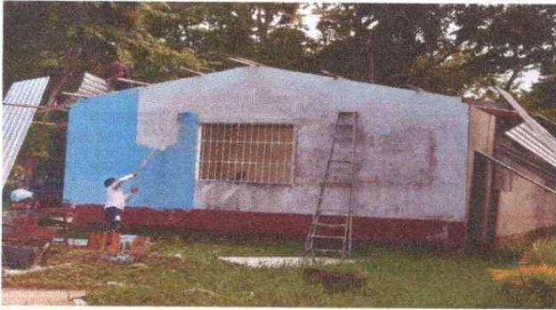
Foto 1: Sustitucion de lamina, por lamina troquelada alucin calibre 26