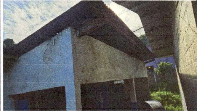
Foto 10: REMOZAMIENTO DE TECHO SUMINISTRO E INSTALACION DE LAMINA