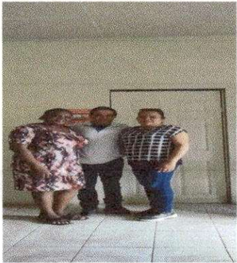
Foto9 : EVALUADOR DE CAMPO CON AUTORIDADES DEL ESTABLECIMIENTO EDUCATIVO