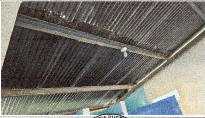
Foto 11: REMOZAMIENTO DE TECHO SUMINISTRO E INSTALACION DE ESTRUCTURA METALICA.