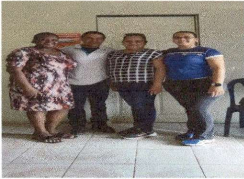
Foto1: . EVALUADOR DE CAMPO CON AUTORIDADES DEL ESTABLECIMIENTO EDUCATIVO