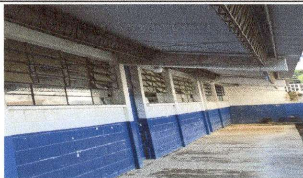
Foto 5: MODULO "A" AULAS SUMINISTRO E INSTALACION DE BALCONES DE METAL