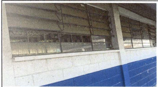
Foto 4: MODULO "A" AULAS SUMINISTRO E INSTALACION DE BALCONES DE METAL