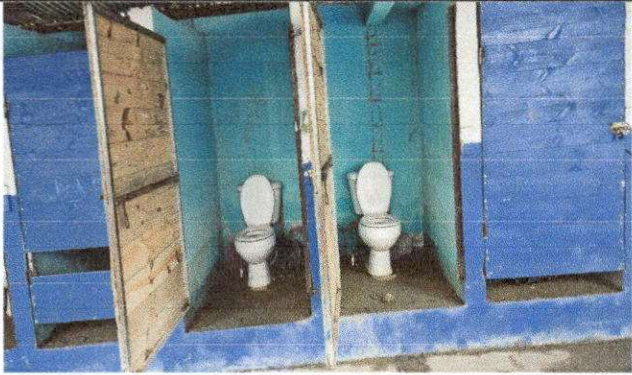
Foto7: . MODULO "B" SERVICIO SANITARIO REMOZAMIENTO EN PISO Y PAREDES DE BAÑOS