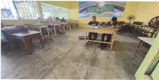
Foto 3: REMOZAMIENTO DE PISO, SUMINISTRO E INSTALACION DE PISO CERAMICO ANTIDESLIZANTE