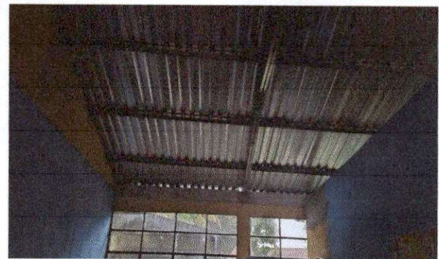
Foto 8: REPARACION SISTEMA ELECTRICO, CAMBIO DE TABLERO DE 8 FLIPONES, SUMINIISTRO E INSTALACION DE SISTEMA ELECTRICO ILUMINACION