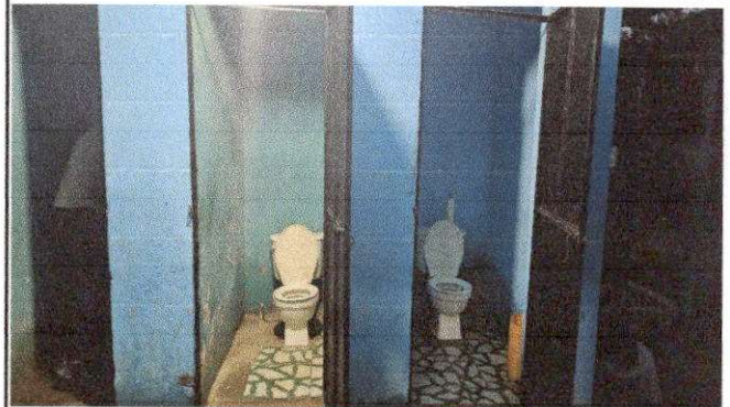
Foto 10: SERVICIO SANITARIO SUMINISTRO E INSTALACION DE PISO CERAMICO ANTIDESLIZANTE