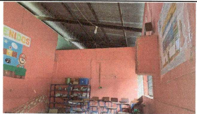
Foto 6: REMOZAMIENTO DE TECHO, SUMINISTRO E INSTALACION DE CIELO FALSO