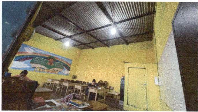
Foto7: REMOZAMIENTO DE TECHO, SUMINISTRO E INSTALACION DE CIELO FALSO