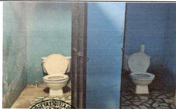
Foto 11: SUMINISTRO E INSTALACION DE INODORO Y SUMINISTRO E INSTALACION DE AZULEJO