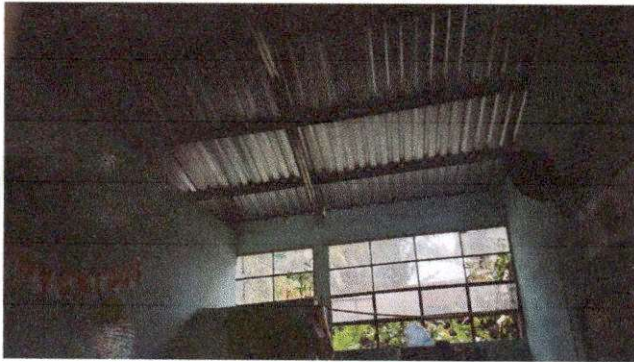
Foto 9: REPARACION SISTEMA ELECTRICO, CAMBIO DE TABLERO DE 8 FLIPONES, SUMINIISTRO E INSTALACION DE SISTEMA ELECTRICO FUERZA