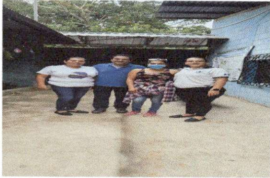
Foto1: EVALUADOR DE CAMPO CON AUTORIDADES DE CENTRO EDUCATIVO