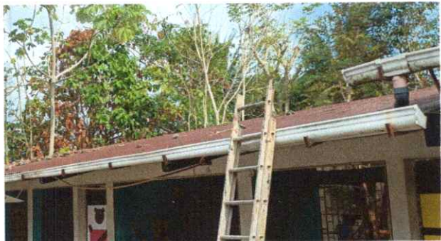
Foto1: Evidencia de las laminas acanaladas de 3 aulas en mal estado.