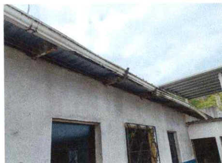
Foto 6: Evidencia de canales, cenefa y caída de agua pluviales en mal estado.

Observación: Si es necesario se pueden agregar hojas adicionales y actualizar el número de hojas.