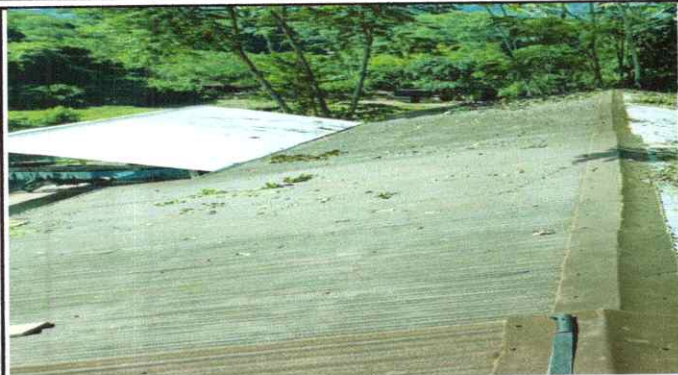
Foto 1: sustitución de lámina, por lámina troquelada aluzinc calibre 26