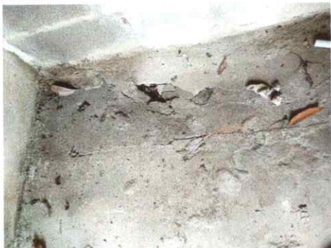
Foto 3: Evidencia del piso de la bodega de la dirección en mal estado.