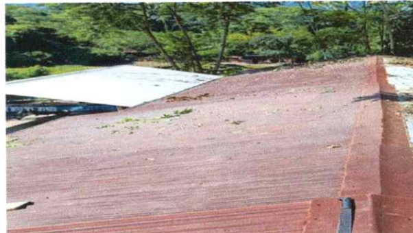
Foto 2: Evidencia de laminas acanaladas de los servicios sanitarios en mal estado.